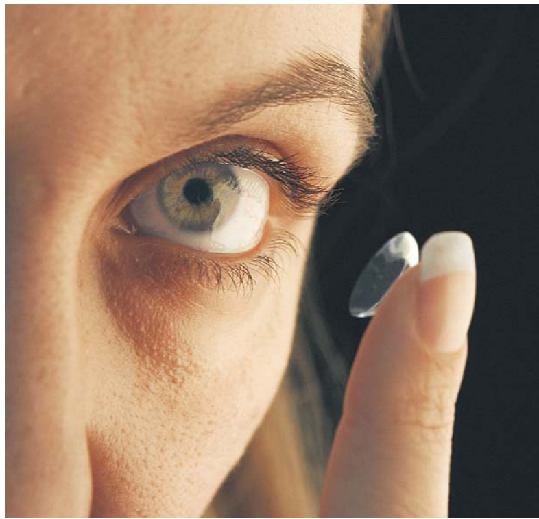
Immer beliebter. Der Anteil von Kontaktlinsen am Markt für Sehhilfen wächst – auch weil die Preise sinken.

...Anbieter im Kon- ...ören gleich zwei ...e: Novartis und ...Tochter Ciba Visi- ...i Kontaktlinsen als ...Schweiz und Eu- ...e in den USA ange- ...nen führenden An- ...stlé-Tochter Phar- ...tinsen auch phar-